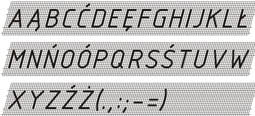
Rys. D.1. Pismo techniczne wg PN-EN ISO 3098: 2002 — duże litery alfabetu łacińskiego i polskiego (pismo rodzaju B, pochyle)